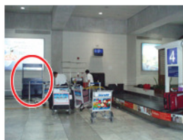
荷物預けカウンター(国内線)

4番5番ターンテーブルの間(★マーク参照)にある荷物預けカウンター(国内線)に、先ほどの申告書を渡しもう一度荷物のチェックインをします！！