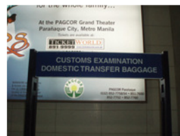
左写真の拡大写真